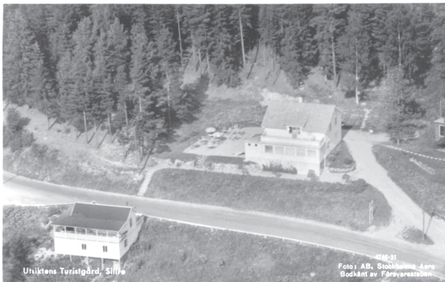
Utsiktens turistgård före utbyggnaden av RV 86.

År 1948 stod den stora nybyggnaden ovanför vägen klar. Efter Andra världskriget var det brist på byggmaterial och man fick inte bygga pensionat utan endast privatbostäder. Tre rum fick