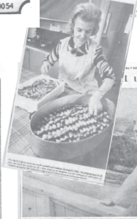
... till smörgåsar med äg- "älgsafari" och andra