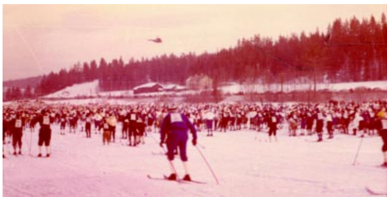
Vasaloppstarten 1965. Vidar Viksten förskonades ifrån den här utsikten tack vare en hjälpsam skogsvaktare.

Nu gällde det verkligen att ta det kallt, att inte dras med i tempot. Mitt mål var endast att klara medaljen. Efter en rejäl tjuvstart blev det vild rusning över det långa startområdet. Jag låg så långt fram att det aldrig blev någon stockning, men inte heller någon chans till vila. Hade jag klivit ur spår för att släppa fram andra åkare så hade jag inte kommit in igen. Skidorna gick väldigt bra. På de långa flacka myrområdena med stakäckning gick det snabbt undan. Första kontrollen var vid Mångsbodarna efter 25 km.