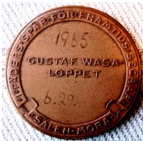
Vidar Vikstens Vasaloppsmedalj, framsidan (t.v.) och baksidan. Diameter 40 mm.

Här insåg jag att i det här sällskapet av åkare hörde jag inte hemma med min träningsmängd. Jag drog ner rejält på tempot och snalåkte för att hushålla med krafterna. Jag kom fortfarande mycket väl ihåg hur jobbigt det var under Vasaloppet 1963.