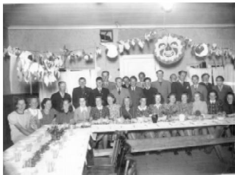
Lilla salen eller kaféet på Viljansborg. Troligen ett SLU-möte (motsv. idag ungcintern) under 1940-talet.

Min mamma sydde mina kläder, klänningar i ylletyg eller chiffong, ett tunt sidetyg. Jag ritade själv modellerna till mina kläder. Sammet