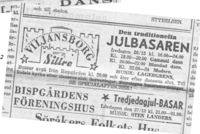
Sundsvalls Tidning Tisdag 23/12 1952