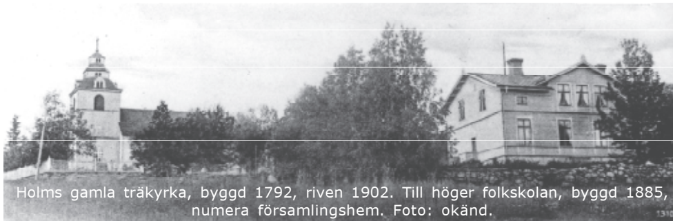
Holms gamla träkyrka, byggd 1792, riven 1902. Till höger folkskolan, byggd 1885, numera församlingshem.

Holms kyrka är en "minikatedral" i nygotisk stil och med ett mycket ovanligt utseende för en landsbygdskyrka. Denna vackra kyrka invigdes den 25 september 1904. Exakt på dagen 100 år senare uppmärksammades jubileet med konsert (på lördagen) och besök av biskopen Tony Guldbrandzén (på söndagen). Jubileumsfirandet varade i dagarna två och var välbesökt med ca 170 besökare per dag.