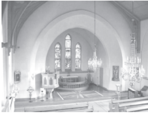
Kyrkans nuvarande interiör.